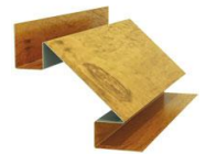
Планка угла внутреннего сложного