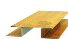
Планка стыковочная сложная