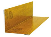
Планка угла внутреннего