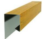
Планка завершающая сложная