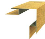
Планка угла наружного сложного