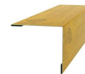
Планка угла наружного